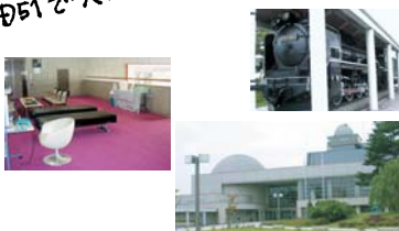
十和田市民文化センター★

いいにおいの藤棚が あるから、デートして。め。 子供ごころのある彼氏なら DS1で犬はしゃぎかも。 十和田市民 文化センター★