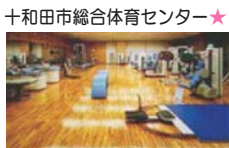
十和田市総合体育センター★

↑ どちらからも出入りできる レストランとわた おすすぬ馬肉ラーメン。 十和田信用金庫★