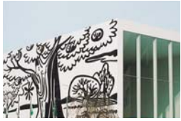
十和田市現代美術館