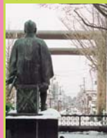
街を眺める新渡戸博翁