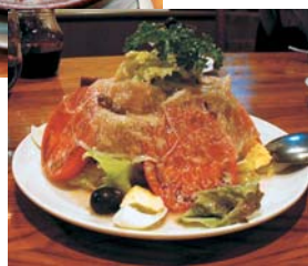
スペインサラダ 1,050円～