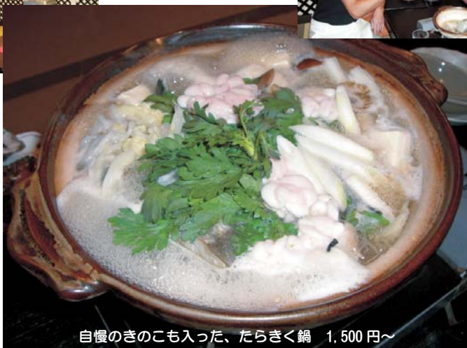
自慢のきのこも入った、たらきく鍋 1,500円〜