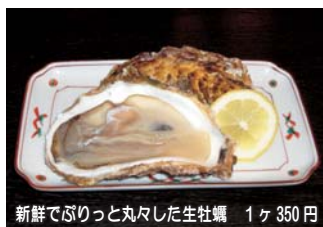
新鮮でぷりっと丸々した生牡蠣 1ヶ350円