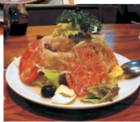
スペインサラダ 1,050円～