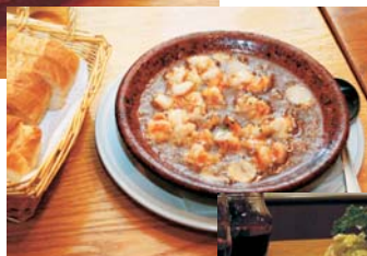
小エビのガーリック風オイル焼 630円～

東二番町 2-48 ☎ 0176-25-2524 ◎火～土 17:30～23:00 日・祝 17:30～22:00 ◎月曜日 閉有