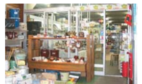
①松本茶舗 稲生町17-5 ☎0176-23-2138 🕒9:00~19:00 📅元日、2日 📍西側