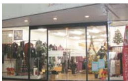
②江渡呉服店 稲生町15-7 ☎0176-23-2058 🕒10:00~18:30 📅日曜日 📍西口