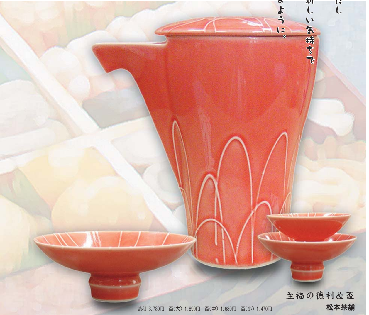
至福の徳利&盃 松本茶舗

神様を迎える清浄な場所であることを示す門松。そう、『破竹の勢い』というように竹は一晚に20〜30センチも伸びる。縁起を担いでこの家も『破竹の勢い』で繁盛しますように…という願いを込めて、今年も門松を飾ろう。